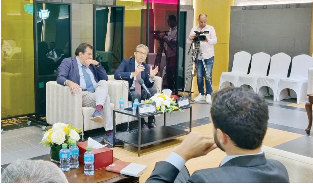
بالدوتشي وسيريتي خلال الندوة