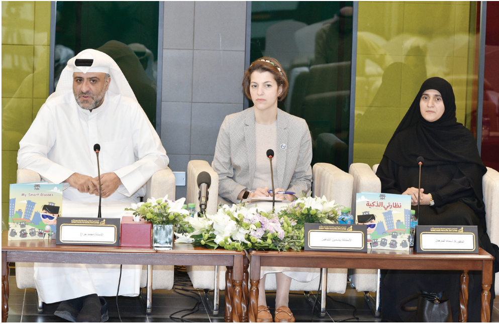
السرطان والشاهين وجراغ متحدثين خلال الندوة